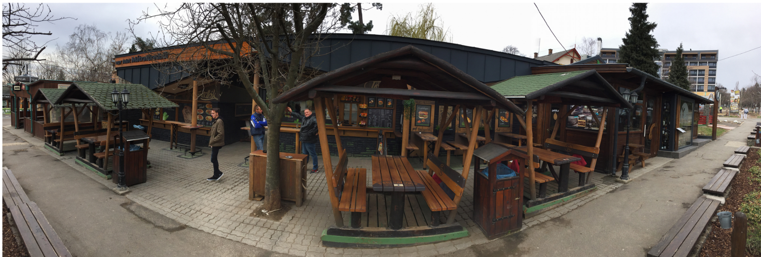
Grill Land Gyros