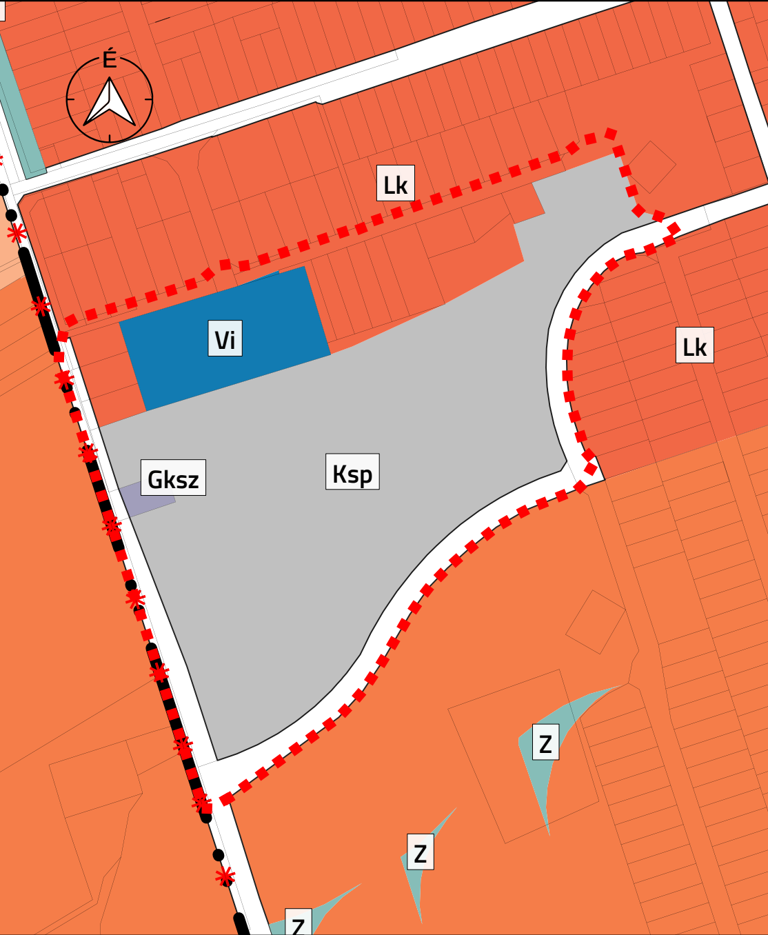
M 1:4000 - HATÁLYOS TERÜLETFELHASZNÁLÁS RÉSZLET 2. TERVEZÉSI TERÜLET