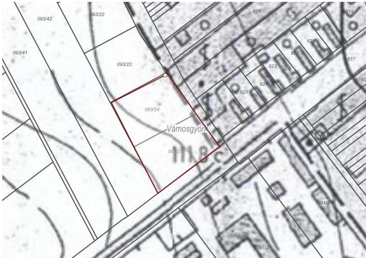
1. térkép: A vizsgált terület helyrajzi számos térképe