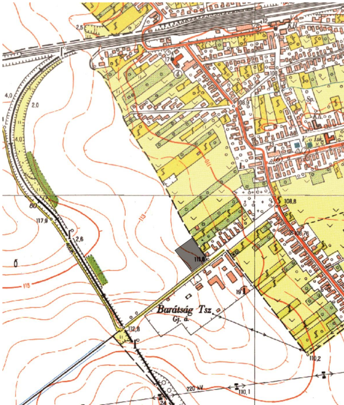
2. térkép: A vizsgált terület EOV térképe